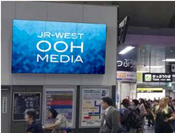
京都駅西口マルチデジタルサイネージ