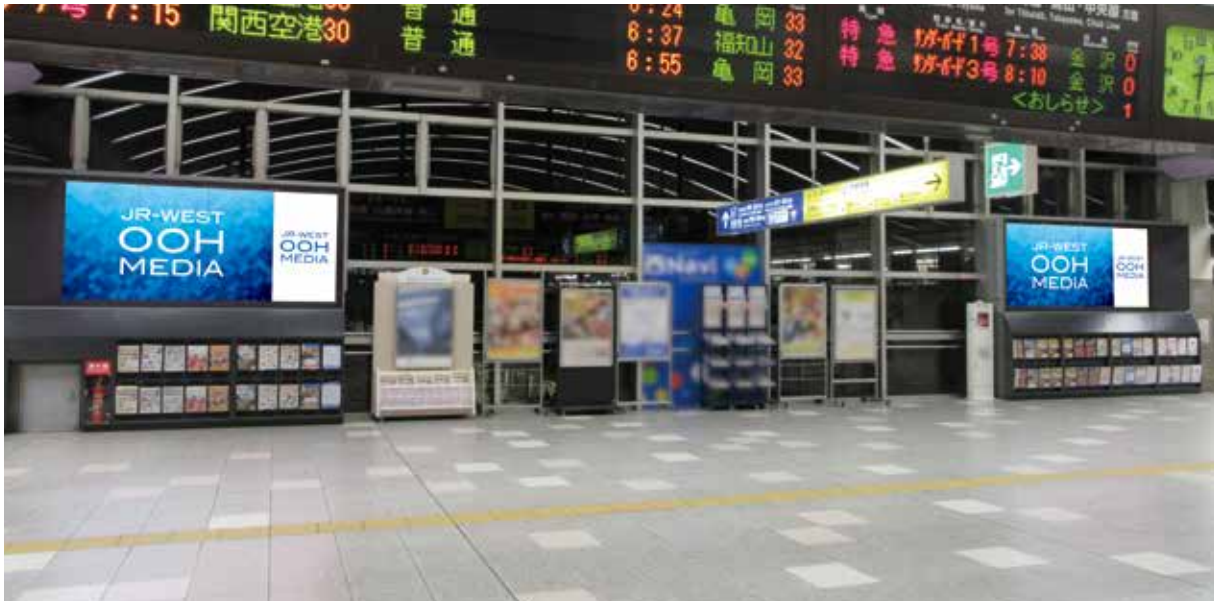
京都駅橋上マルチビジョン8