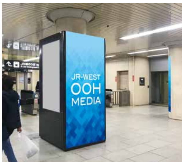
プラス1 柵外からの写真