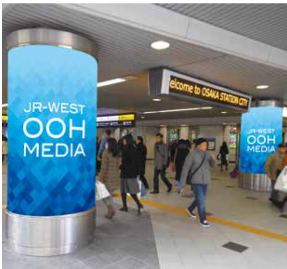
電照 (LED) 仕様です