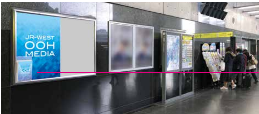
京都駅 (ポスタープラス)