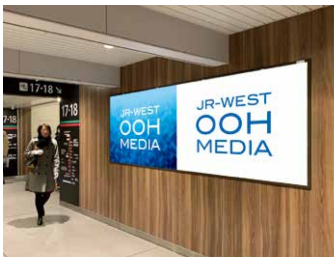
天王寺駅(ハーフI)(ハーフII)