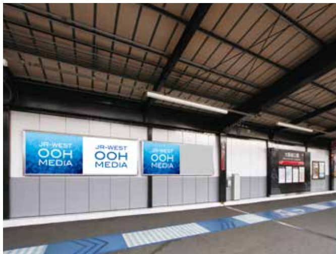
大阪城公園駅(ハーフI)(ハーフII)(ハーフIII)