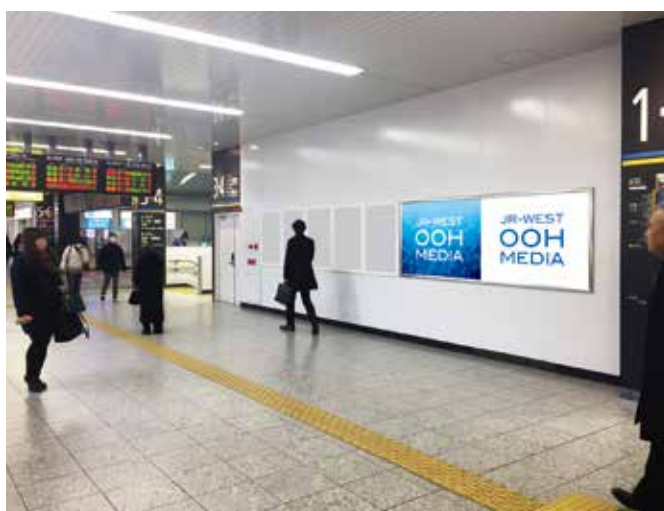
尼崎駅(ハーフI)(ハーフII)