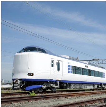
うめきた限定ソダテツ 271 系 関空特急「はるか」