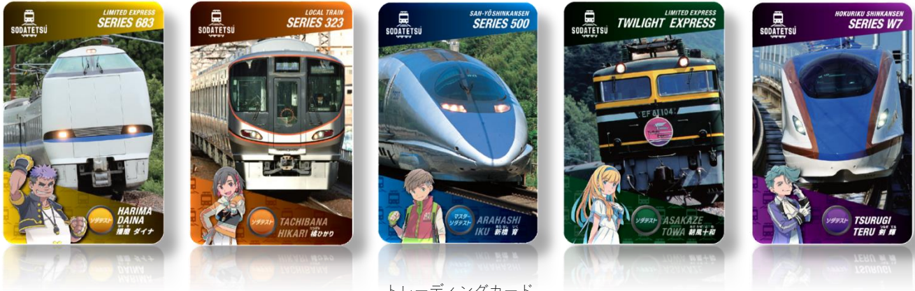
トレーディングカード