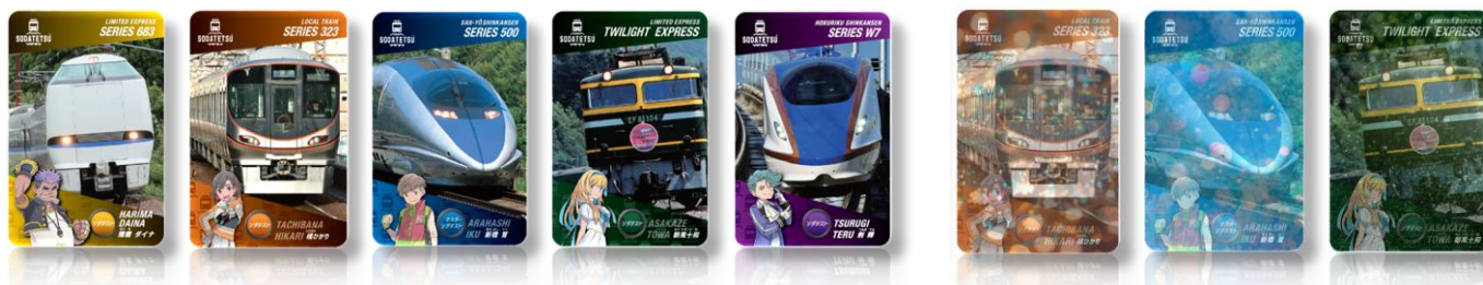
ノーマルカード5種